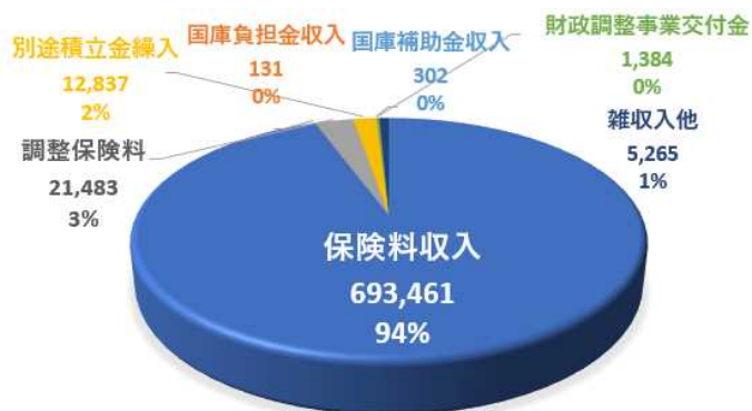
令和4年度決算 収入：1人当り額（単位：円）